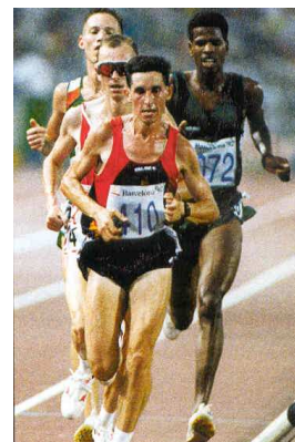
Carlos de la Torre al frente de un grupo de atletas en la primera semifinal de 10.000 metros en los Juegos de Barcelona