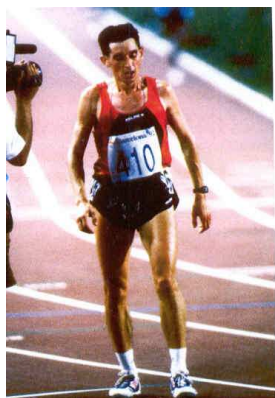
El atleta de Marín una vez concluida la carrera de diez Kilómetros en Barcelona 92